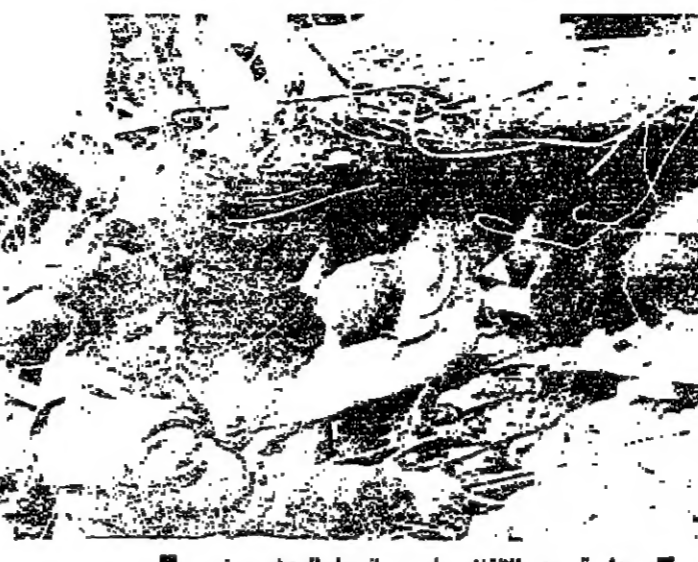
جثة بين الانقاض في رومانيا والبحث مستمر

ارتفع عدد الوفيات في الزلزال الذي ضرب رومانيا الى ٦٠٠ امس في وقت لا تزال فرق الانقاذ تبحث من جث أخرى تحت اطنان من الانقاض . وقالت وكالة اتيه «انفريس» الرسمية انه على مر حتى ليل امس الاول على ٥٠٨ جث في بوخارست . وكان قد عثر على ٧٢ جثة في ارجاء مفرقة من البلاد التي ضربتها الهزات الارضية يوم الجمعة الماضي . وتخشى السلطات الرسمية ان يكون هناك اعداد لا يزالون مدفونين تحت الانقاض . بوخارست - ر